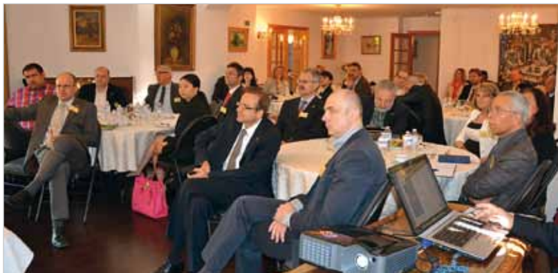
Stretnutie podnikateľov na pôde Slovenskej ambasády v Ottawe. Bližšie informácie o misii do Kanady vám prinášame na strane 2.

Číslo 7-8 / Ročník VI. • Júl/August 2013