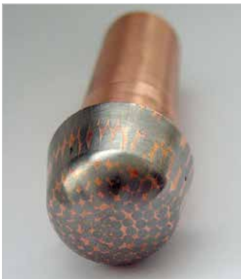
Štruktúra elektródy z W-Cu kompozitu na vedenie tepla s vysokoteplotnou odolnosťou.

Uvedené obmedzenia v podstatnej miere odstraňuje vynález kompozitu na vedenie tepla s vysokoteplotnou odolnosťou vyvinutý v Ústave materiálov a mechaniky strojov SAV. Kompozit je schopný dlhodobo znášať vysoký tepelný tok, pričom odoláva aj vysokým teplotám. Vyznačuje sa novou štruktúrou (architektúrou), ktorá zabezpečuje účinný odvod tepla z povrchu kompozitu vystaveného vysokej teplote do chladiacej časti