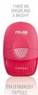
ERASER & BRUSH CAPSULE