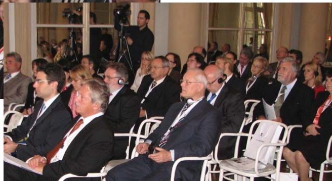
Využijeme skúsenosti Bazilejského regiónu?

zapojenia sa a konkrétnej kooperácie medzi členmi iniciatívy a relevantnými subjektmi je na slovenskej, českej i maďarskej strane stále nižšia ako na rakúskej strane. Skoda, pri zapojení do iniciatívy sme sa totiž zaviazali k rovnocennej participácii na spolupráci. Presne v duchu motívu, zosobňujúceho zmysel projektu Centrope – Rastieme spolu. Spolu zrastáme.