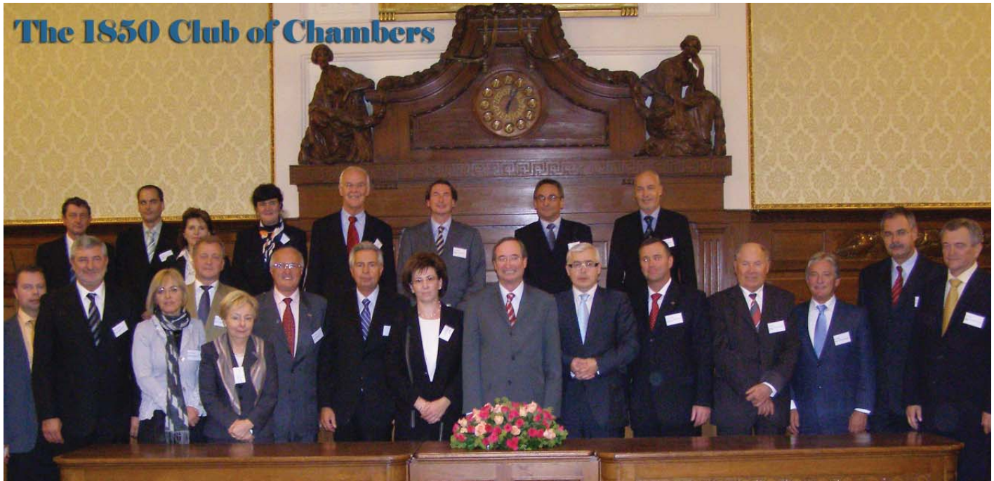
Ustanovujúce stretnutie klubu obchodných komôr, založených v roku 1850, sa konalo na hospodárskej komore Viedeň v Rakúsku.