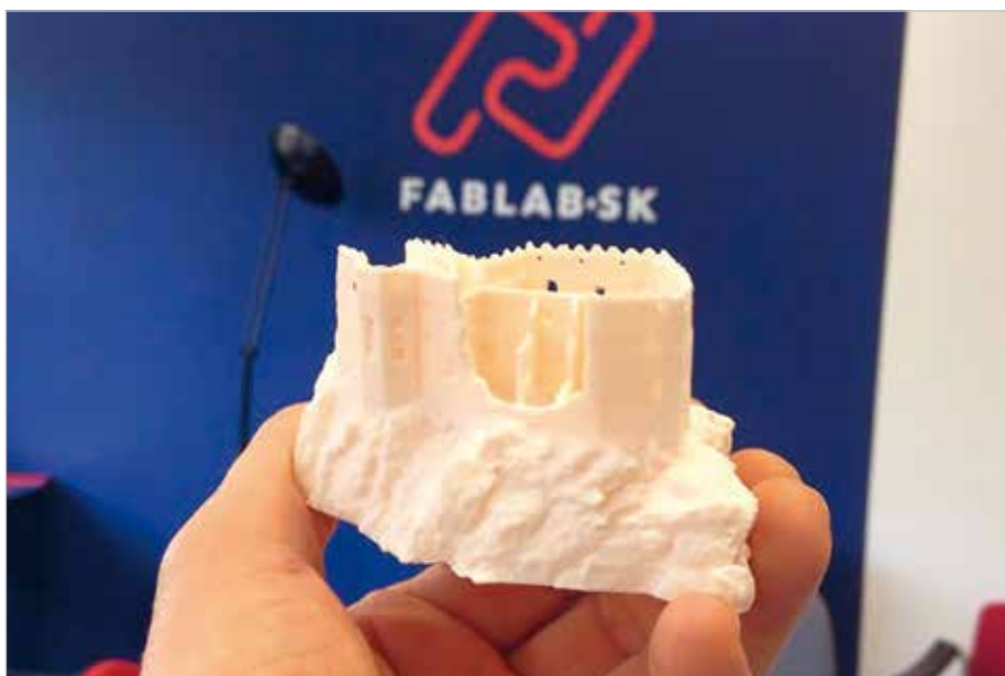
Vo FabLab je k dispozícii aj 3D tlačiareň, na ktorej sa dá „vytlačiť“ aj takýto model hradu Beckov.

Expertné podporné služby, ktoré už dnes poskytujeme na webovej stránke projektu www.npc.cvtisr.sk , zahŕňajú ako proces priemyslno-právnej ochrany duševného vlastníctva, tak aj procesy súvisiace s jeho komercializáciou. Prechádzajú od identifikácie výsledkov výskumu a vývoja, vhodných na priemyslno-právnu ochranu, cez posúdenie prínosov technológie a realizáciu ochrany (príprava a podanie patentových a iných prihlášok), až po marketingové prezentácie technológií, ▶